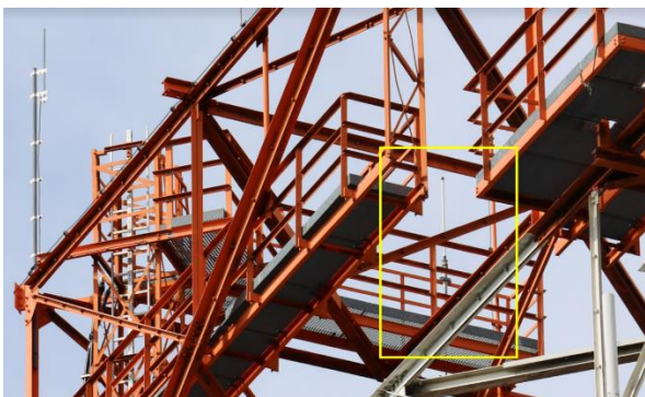
In der gelben Umrandung ist die aktuelle Antenne von DB0ND zu erkennen.

50 Meter hoch ist das Gittergerüst. Für die DRG steht die oberste linke Ecke zur Verfügung.