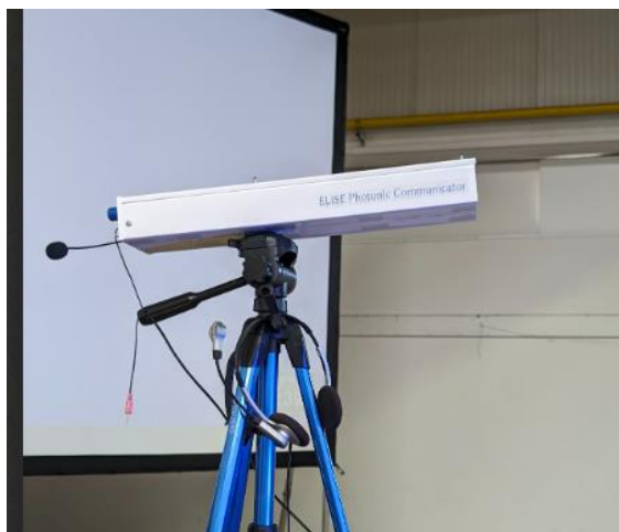
Licht-Transceiver der AATiS

Bleiben wir beim Vergleich der beiden Veranstaltungen: In Kassel finden sich alle Aktivitäten in einer Halle. Gefühlt war diese Halle etwas kleiner als die Halle 1 in Friedrichshafen. Da gibt es dann aber auch wirklich alles. Von der Aktionsbühne, über die Stände der kommerziellen Aussteller, die Tische der Vereine und Interessengruppen, die Flohmarkt-Tische und verschiedene Gastronomieangebote nebst Bestuhlung.