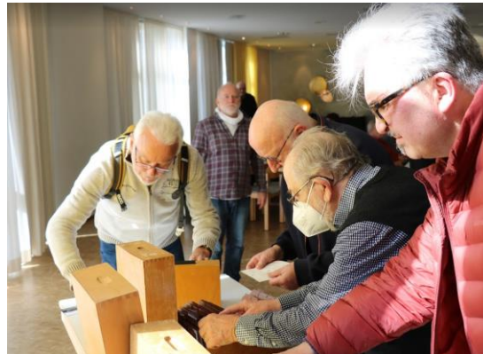
Großer Andrang an den QSL-Kisten