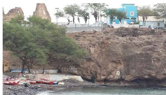
Sloper vom Haus an den Strand

Watt und einem Draht als „Sloper“ am Strand wurden unter D44TPE einige Verbindungen gemacht. Leider nahm das Vorhaben schlagartig unbeabsichtigt ein vorzeitiges Ende: die Morsetaste wurde beim abendlichen Abbau der Antenne entwendet.