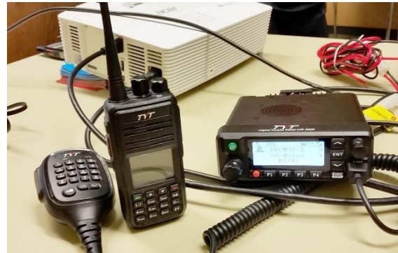
Links: eine Tytera MD-380 (70cm) Handfunke – rechts ein MD-9600 Duo-Bander (70cm/2m)

Nach fast 2 Stunden und einigen praktischen Demonstrationen mit zwei Modellen traten die Teilnehmer voll informiert wieder den Heimweg oder den Standortwechsel in die Gaststätte an.