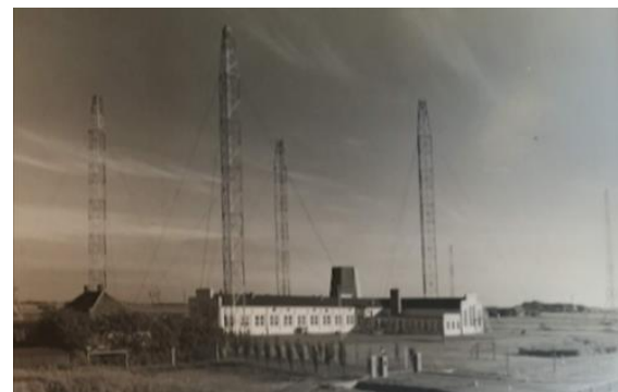
Erste Anlage am Westerloog

Wir bekamen einen neuen „Nachbarn“ in unserer Ecke des Platzes und kamen irgendwann ins Gespräch. Da erst erfuhr ich, dass die komischen Gebäude auf dem Platz schon etwas älter sind und früher die Verwaltung von Norddeich-Radio beheimateten. Nun ergab alles einen Sinn. Der ganze Campingplatz im „Westerloog“ war früher das erste Gelände von Norddeich-Radio. Hier standen nicht nur die Sender und Antennen, sondern auch gleich die Masten, welche die Langwellenantennen und Peiler trugen.