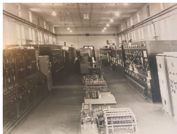
Die Sendetechnik. Heute ein Restaurant