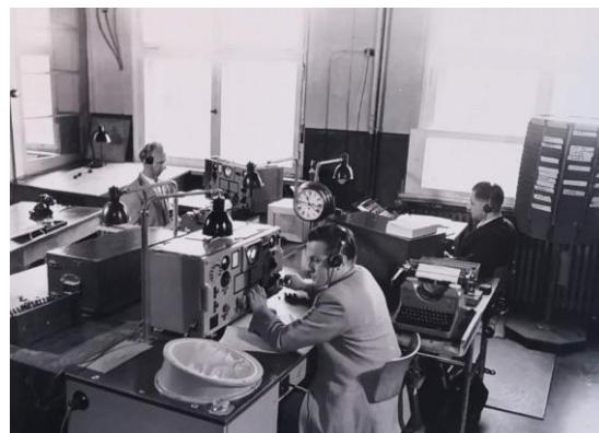
Arbeitsplätze der Funker. Rechts das Telegramm-Karussell

auch mal einen Blick in das Museum zu werfen. „Hier war Norddeich Radio – Ende und Aus“.