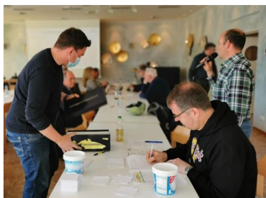
Der Wahlvorstand im Einsatz